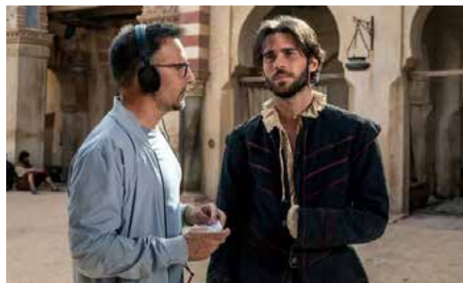
Pre – stage filmación. Fuente Panorama Audio-visual (España)

El Castillo Fortaleza de Santa Pola, el Castillo de Santa Bárbara y los estudios Ciudad de La Luz de Alicante, distintas localizaciones de Valencia y Sevilla serán algunas de las ubicaciones que acojan el rodaje de El cautivo, un largometraje con el que Amenábar buscará, en sus propias palabras, "relatar la oscura realidad en la que vivía Miguel de Cervantes" durante su cautiverio en