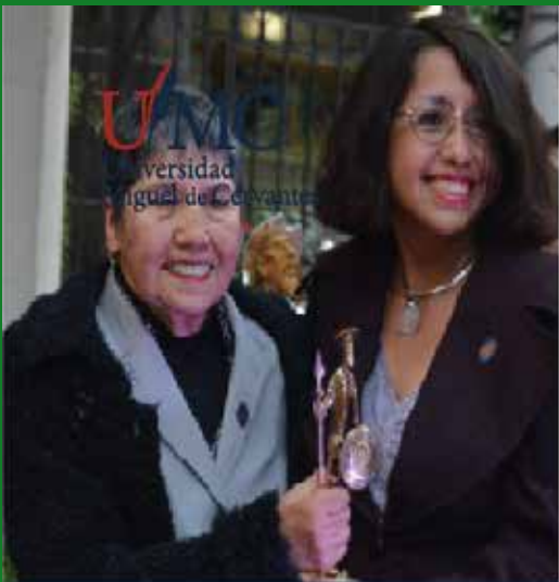
El valor social de las oportunidades