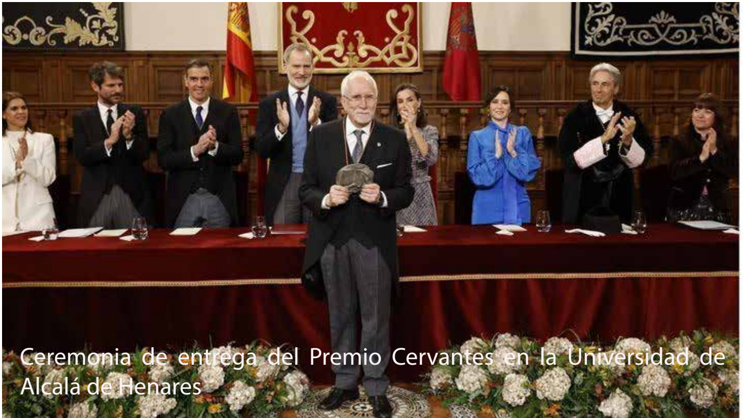
Ceremonia de entrega del Premio Cervantes en la Universidad de Alcalá de Henares